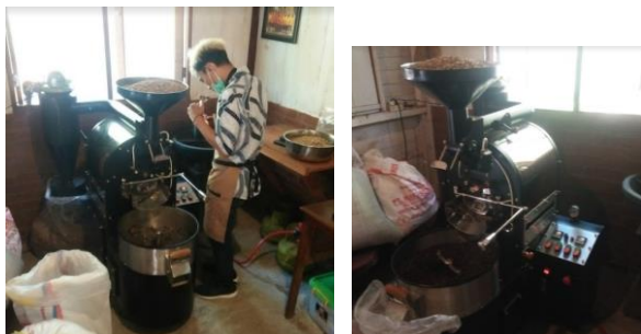
Gambar 4 Pengoperasian mesin roaster skala komersial

Pengopersian dilakukan pada lingkungan sebenarnya, yaitu pada kapasitas 3 kg secara kontinyu. Pengoperasian pada kondisi ini ditetapkan sebagai pengoperasian skala komersial. Kegiatan pengoperasian skala komersial dapat dilihat pada Gambar 4.