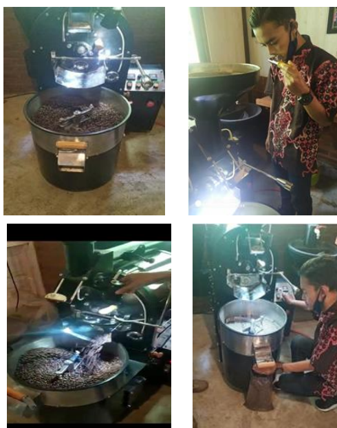
Gambar 3 Uji adaptasi mesin roaster

Setelah pabrikan, roaster diuji fungsional dan adaptasi. Uji fungsional menunjukkan komponen-komponen roaster dapat beroperasi sesuai dengan fungsinya. Uji adaptasi dilakukan di gapoktan Rahayu IV, dan hasilnya menunjukkan bahwa mesin roaster siap untuk dioperasikan pada lingkungan aktual dan kapasitas aktual. Kegiatan uji adaptasi dapat dilihat pada Gambar 3.