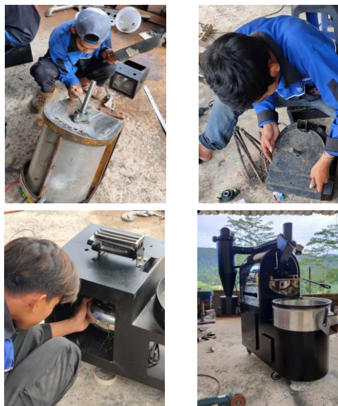
Gambar 2 Proses pabrikan roaster

Roaster dipabrikasi di workshop. Kegiatan pabrikan dapat dilihat pada Gambar 2.