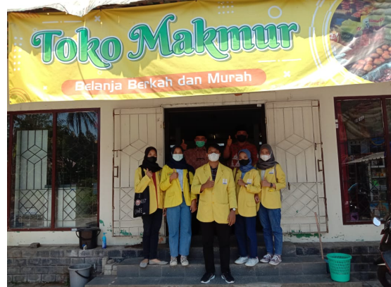
Gambar 3. Pendampingan dan Supervisi