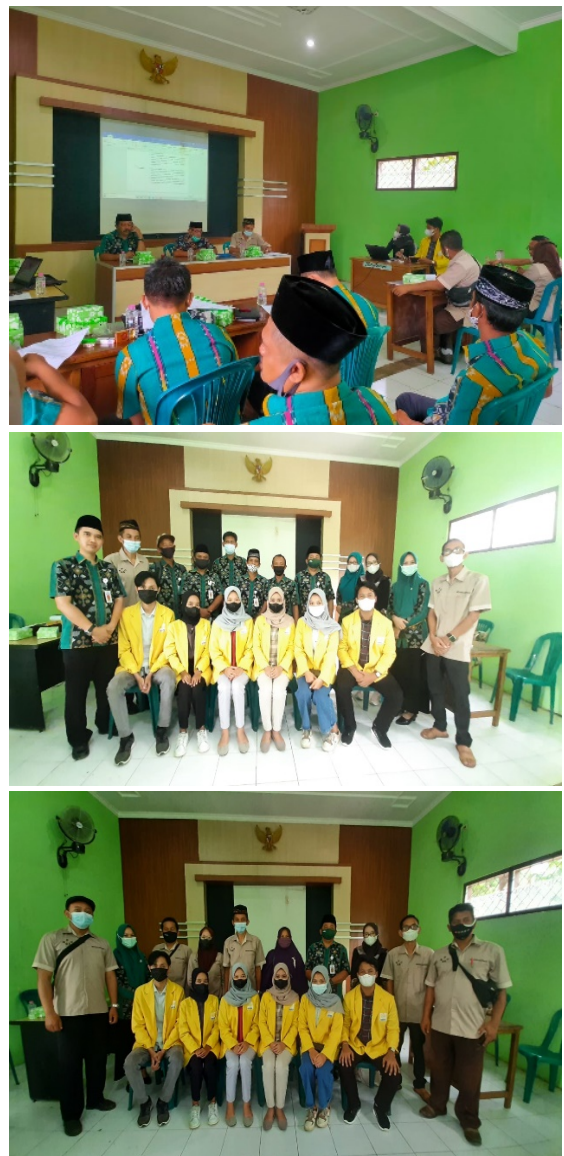
Gambar 2. Pelatihan Edukasi Green Economy

lingkungan dan berkelanjutan, pengelolaan limbah dan sampah baik organik maupun aorganik, pengenalan prinsip teknologi ramah lingkungan, konsep desa wisata yang berorientasi pada Sustainable Development Goals (SDGs), dan pemetaan potensi yang dimiliki Desa Gedangan. Acara digelar bersamaan dengan Musyawarah Desa (Musdes) yang membahas unit usaha BUMDesdi mana pengelolaan sampah, desa wisata, dan potensi alam yang ada di Gedangan dapat menjadi inovasi unit usaha bagi BUMDes untuk mendongkrak ekonomi desa.