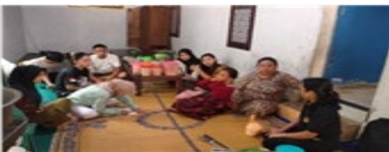
Gambar 2. Rangkaian pemasangan dan pengujian mesin dan alat di lokasi produksi serta pelatihan dan pendampingan rutin membuat olahan kimpul.