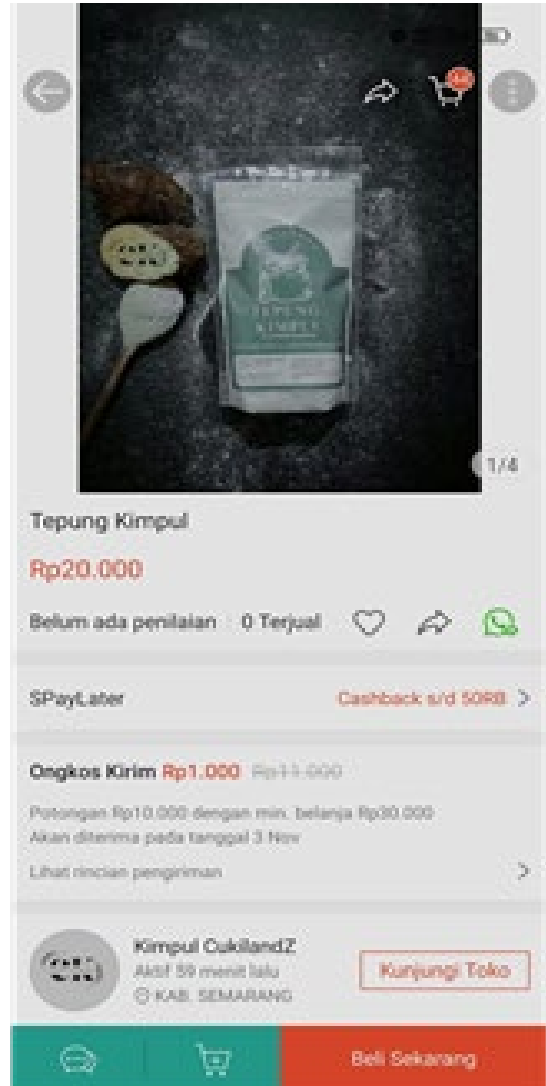
Gambar 4. Pelatihan penggunaan kasir Android dan pemasaran online “Cukilandz” (A). Pelatihan manajemen usaha dan manajemen pemasaran (B). Produk tepung yang telah diproduksi dan akan dipasarkan (C). Akun penjualan Cukilandz di e-commerce (D-E).

Setiap minggu, tim UKSW rutin mendampingi mitra pemasar terkait pemasaran, membuat kemasan dan stiker, membantu mencari pasar di luar Cukilan, serta tentang layanan konsumen. Pada saat bersamaan, mitra juga berkeliling memperkenalkan produk tepung kimpul ke toko roti/ bakery di sekitar Kota Salatiga dan memasang iklan di media sosial untuk menjangkau pasar yang lebih luas. Tim