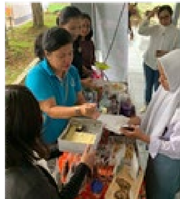
Gambar 3. Produk tepung kimpul yang telah dikemas (kiri). Logo produk “Cukilandz” (tengah). Pengunjung expo mencoba brownies kukus tepung kimpul (kanan).