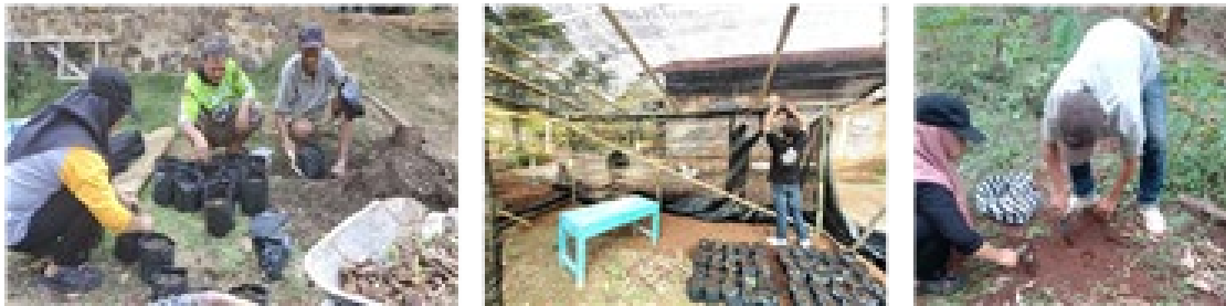
Gambar 5. Pendampingan pembibitan (kiri). Pembuatan nursery bersama mitra (tengah). Pengambilan sampel tanah untuk dianalisis di laboratorium (kanan).

Setelah itu, tim UKSW juga telah mengambil contoh sampel tanah kebun kimpul untuk dianalisis di Laboratorium Tanah Fakultas Pertanian dan Bisnis UKSW. Hasil analisis akan digunakan untuk rekomendasi pemupukan. Jika ingin meningkatkan produktivitas tanaman, maka petani perlu menambahkan unsur hara tambahan mengingat selama ini petani tidak pernah memupuk kimpul. Rekomendasi pemupukan yang sedang disusun akan digunakan untuk pedoman pemupukan bagi bibit kimpul dalam nursery ketika nanti dipindah tanam ke lahan terbuka.